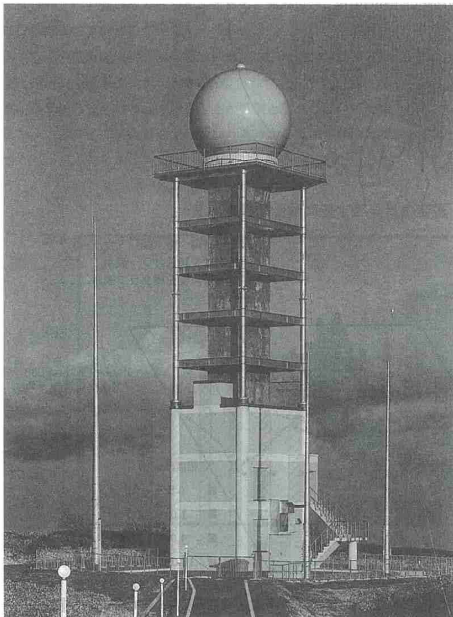
〔横津岳気象レーダー観測所〕