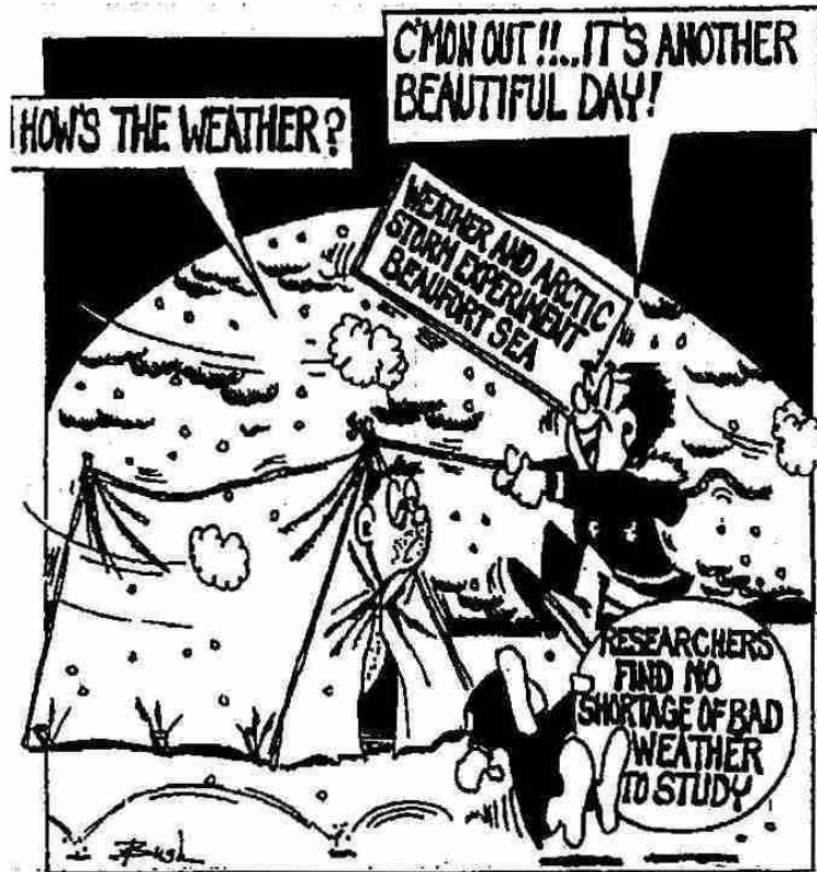
写真9 地元紙“INUVIK DRUM”に紹介されたBASE観測プロジェクトの1コマ漫画。

が運ぶ小石で覆われているが、まだ完全には海が結氷していないので、海岸へりには多くの水蒸気が存在し、夜間冷却で冷えた小石から氷が昇華凝結成長する。いわゆる霜である。まりもの様に氷で覆われた小石がとても珍しかった。また、夜間冷却が激しいときには湖や海の氷面や雪面からも霜が成長する。太陽光をキラキラと反射させ、上を歩くと少しシャリシャリと音がする。この様なとき、道端の小石を湖の氷面上に投げ入れると小石がバウンドするたびに小太鼓のような軽快な音が聞こえ、その音が我々には珍しくしばらくの間小石投げに没頭してしまった。