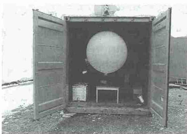
写真3 ゾンデの飛揚光景。