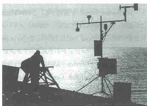
写真4 自動気象観測装置 (Automated Weather Station; AWS)。

の南部にある大都市との間を盛んに行き来し大量の物資を運んでいるが、そこからタックまではツインオッターやドーニャと呼ばれる10人乗り程度のプロペラ機が輸送の主体となる。冬はマッケンジー川の水が凍りアイスロードとなりイヌビクから陸送が可能となって、大量の物資の輸送が可能となるが、その時期には少し早かった。我々のレーダーも飛行機で空輸することとなった。飛行機の運航の交渉は現地で行うことになったが、空港カウンターにいたりんごを頬張りながら仕事をしていたお兄さんは実はパイロットで、ある時は乗客の荷物を運び、生活物資や荷物を機内に固定し、座席を作り、離陸前には乗客にスチュワーデス並の注意を与え、一人で何役もこなしていたのには驚いた。