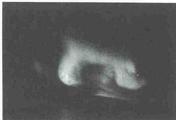
写真6 北極海に映るオーロラ。