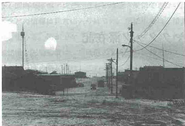
写真1 タックのメインストリート。