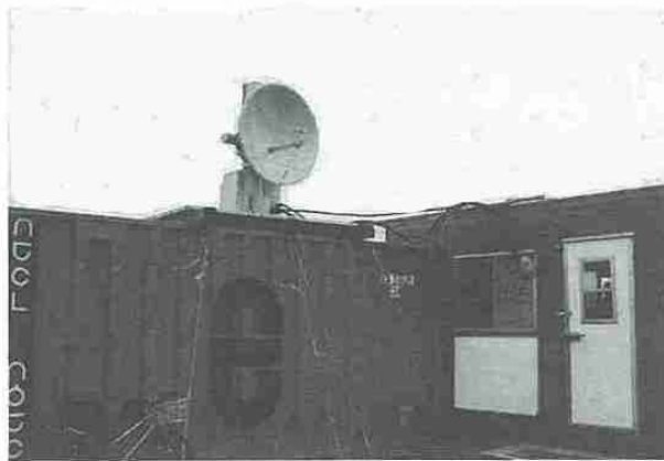
写真2 タックに設置したレーダーサイト。