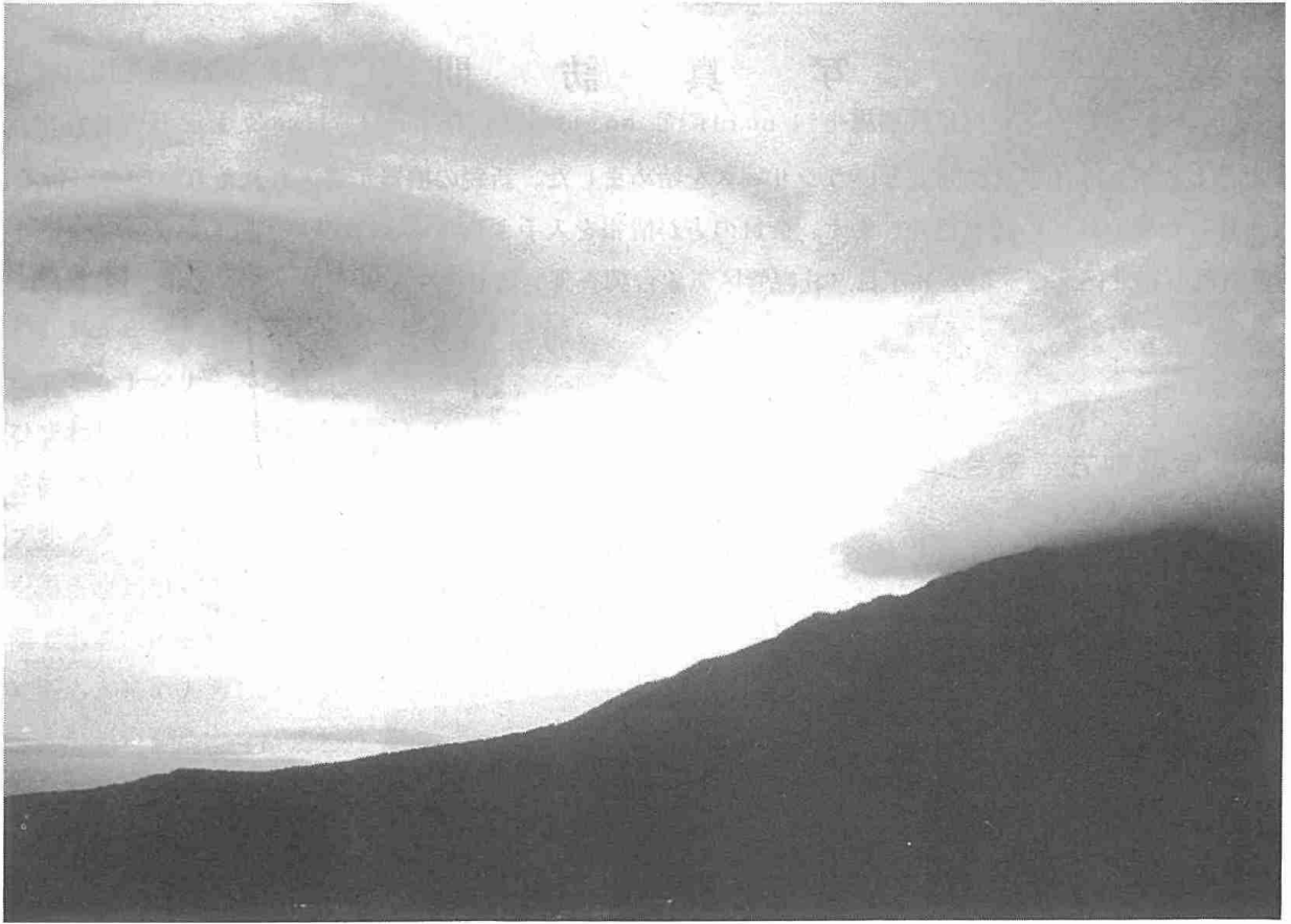
利尻富士の風下に現われたつるし雲と笠雲（本文 34 ページ参照）