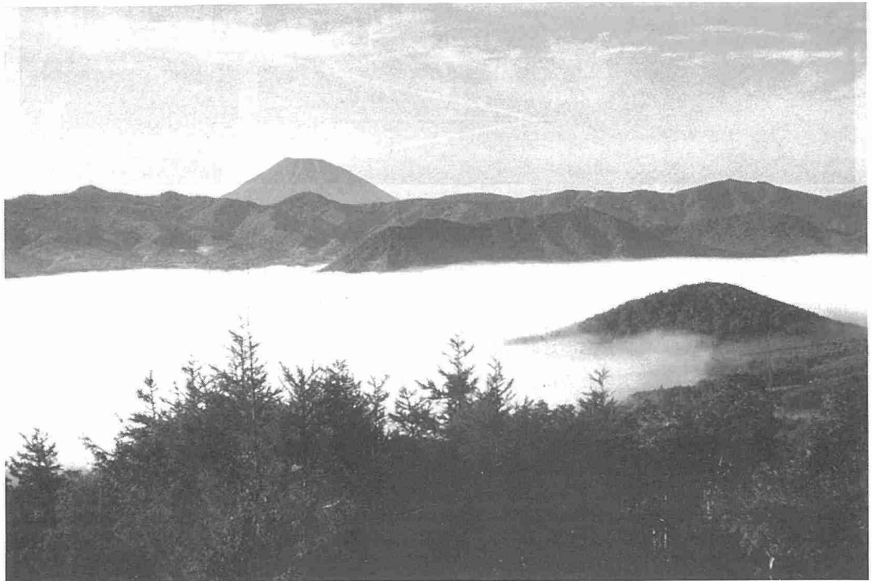
赤井川盆地に発生した放射霧（昭和 57 年 9 月 15 日）