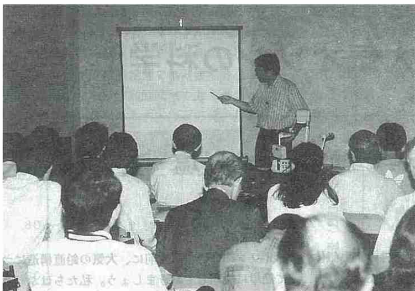
受講風景 (札幌市青少年科学館)