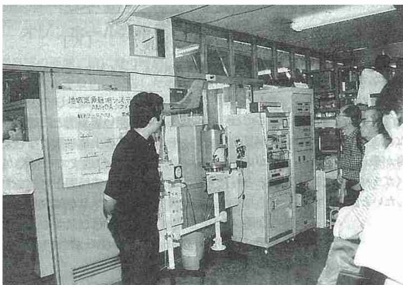
札幌管区气象台 見学風景